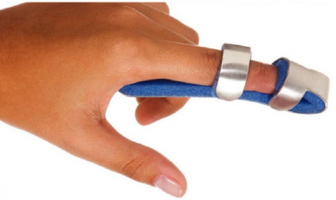
FÉRULA PARA DEDO