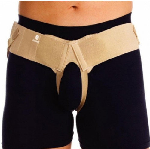
SOPORTE DE HERNIA