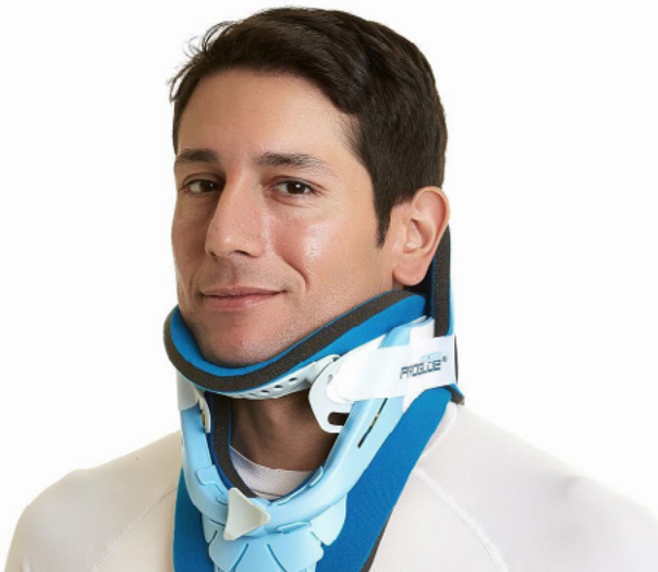
CCPA CUELLO CERVICAL ADULTOS