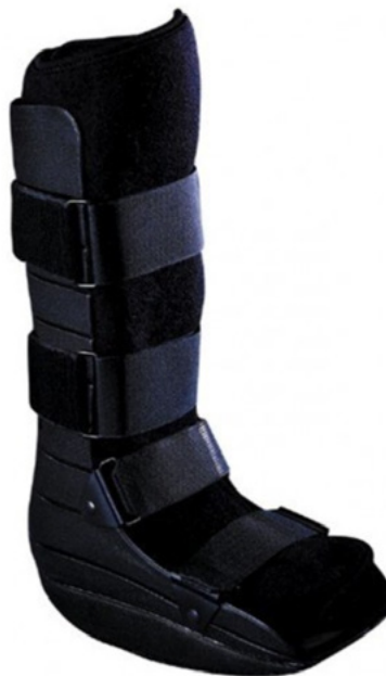
BOTA DE MARCHA