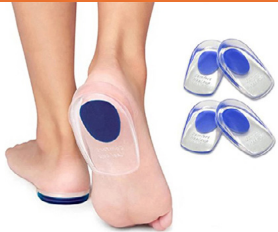
ALMOHADILLAS GEL PARA TALONES