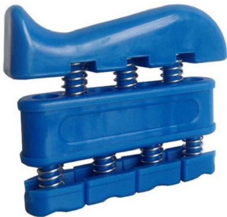
PIANO PARA MANOS