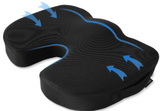
COJÍN ORTOPÉDICO PARA SILLA