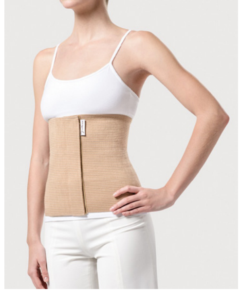
FAJA LUMBAR ELÁSTICA