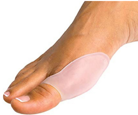
PROTECTOR DE JUANETE EN GEL