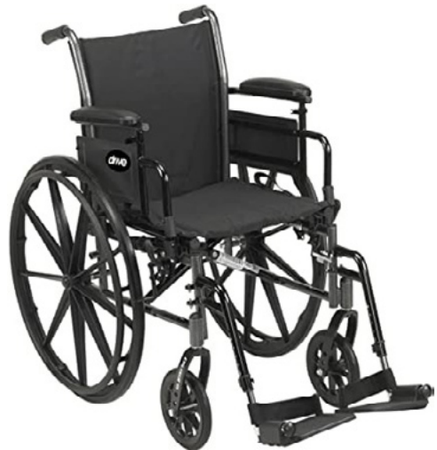
SILLAS DE RUEDAS