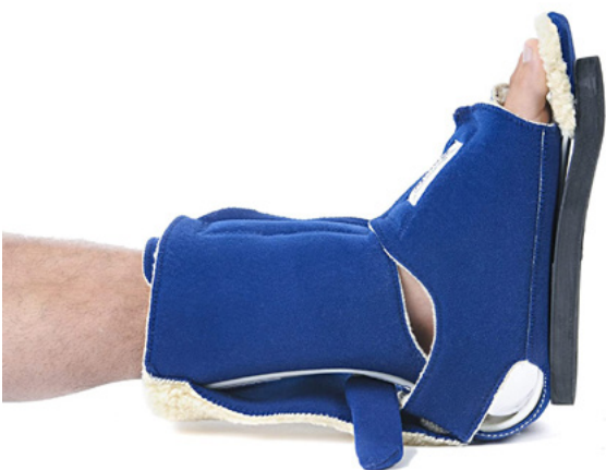
BOTA ANTI-ROTATIVA DE CADERA