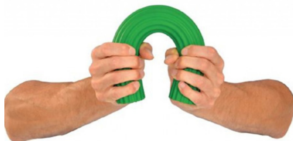
BARRAS PARA EJERCICIO DE MANOS