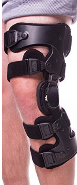
BRACE DE RODILLA