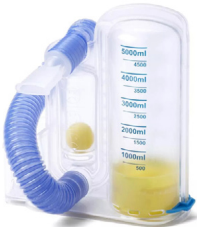
ESPIRÓMETRO DE RESPIRACIÓN PROFUNDA