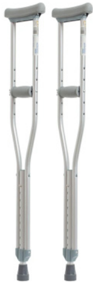
AUXILIAR DE MULETAS