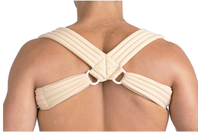
INMOVILIZADOR DE CLAVÍCULA