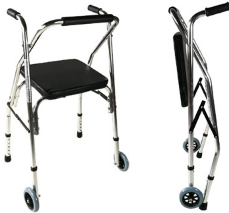
ANDADOR DE ALUMINIO CON RUEDA PLEGABLE