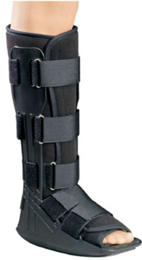
FERULA PARA PIE