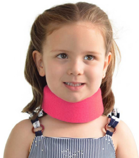
CCPA CUELLO CERVICAL PEDIÁTRICO