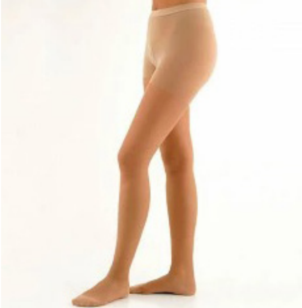
MEDIAS DE COMPRESIÓN PANTIE