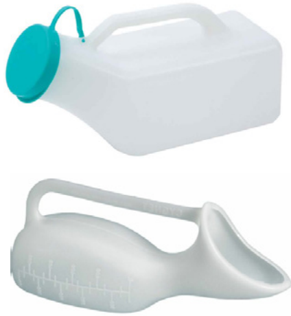
URINAL PARA MUJER Y HOMBRE