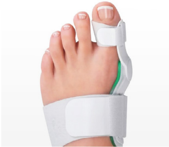
FERULA PARA JUANETE