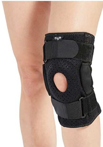
RODILLERAS DE AIRPRENO CON BISAGRA