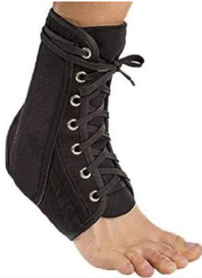
TOBILLERAS CON CORDONES