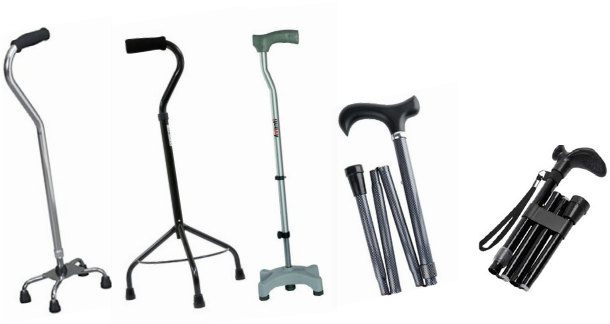
BASTÓN DE 4 PUNTOS