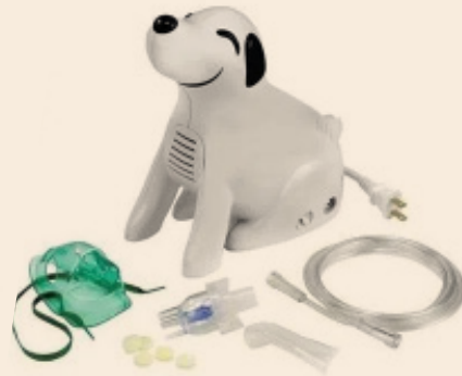
NEBULIZADOR PEDIÁTRICO FORMA DE PERRO-ROSCOE