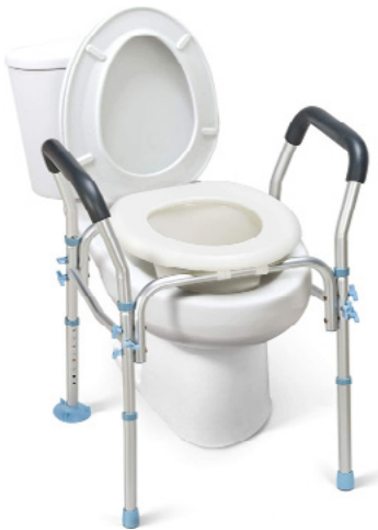
ELEVADORES PARA INODORO