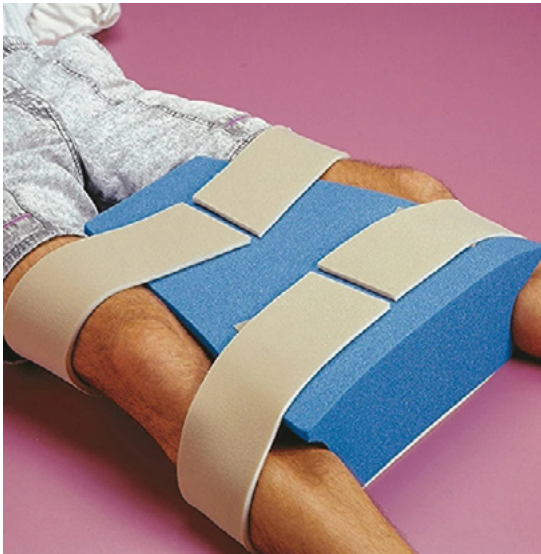
SEPARADOR DE PIERNAS POSTOPERATIO