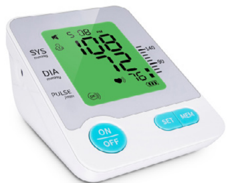
MONITOR AUTOMÁTICO PARA PRESIÓN ARTERIAL