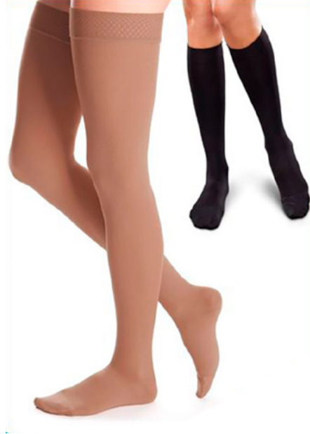
MEDIA DE COMPRESION HASTA LAS RODILLAS