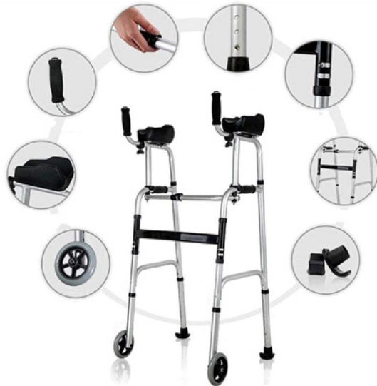
ANDADOR DE LUJO CON RUEDAS - DRIVE ROJO