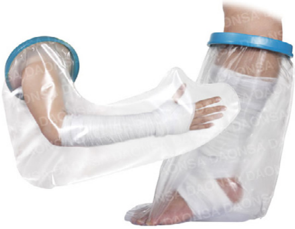
COBERTOR DE YESO