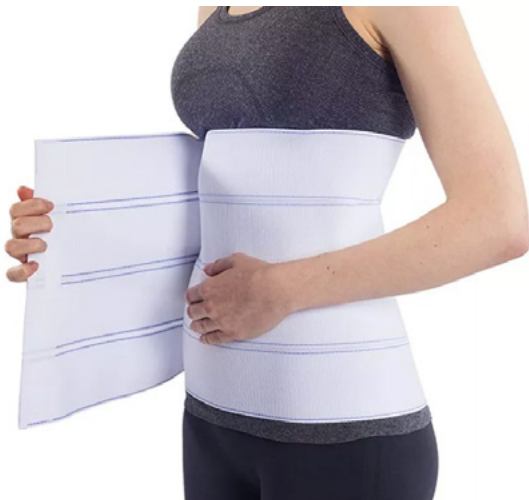
FAJAS LUMBAR DE 4 PANELES