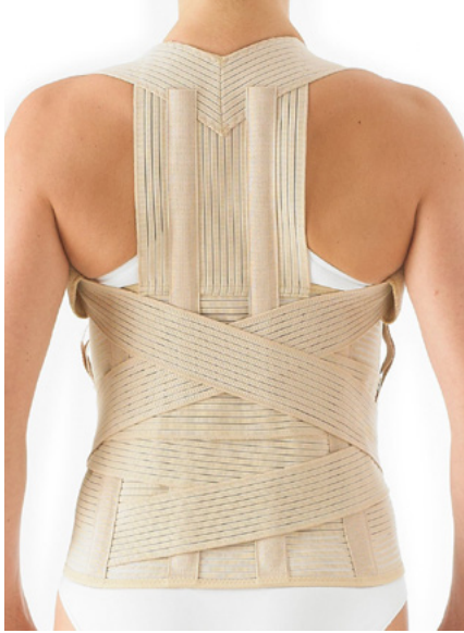
FAJAS DORSO LUMBAR