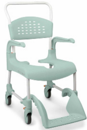
SILLA PARA DUCHA DE ALUMINIO DESLIZABLE CON RESPLADO