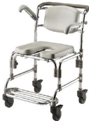
SILLA TRANSPORTE ALUMINIO