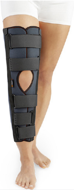
INMOVILIZADOR DE RODILLA DE 3 PANELES