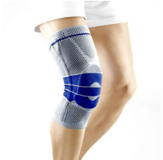
RODILLERA DE AIRPRENO CON BISAGRA