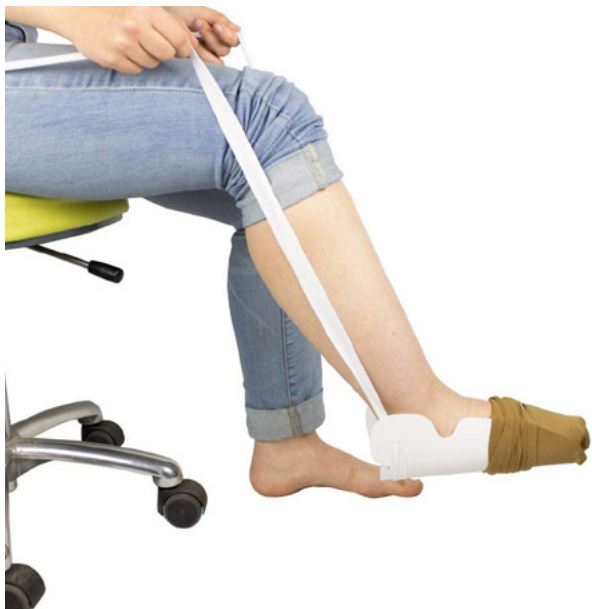
COLOCADOR DE MEDIAS