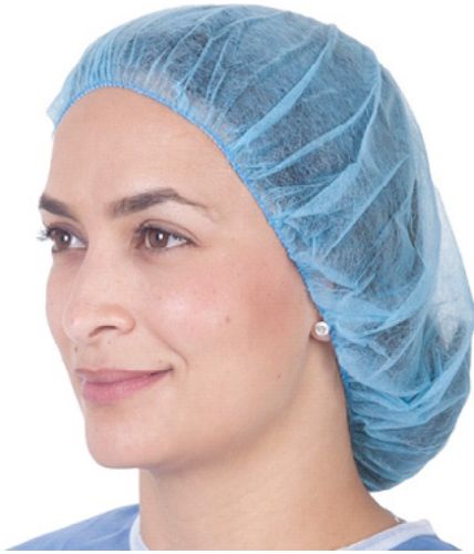
GORROS QUIRÚRGICOS DESECHABLES