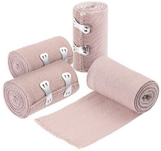
VENDAS ELÁSTICAS DE COMPRESIÓN