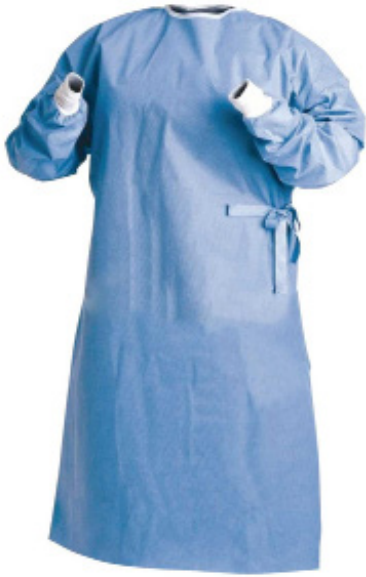
BATAS DESECHABLES PARA CONSULTA