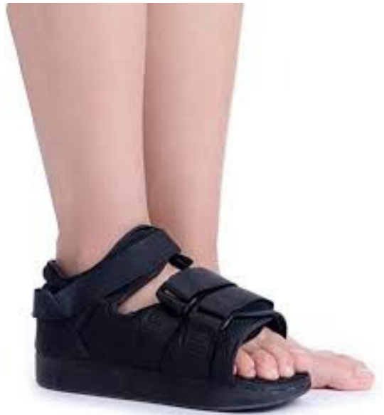
CALZADO PARA YESO PEDIÁTRICO COLOR NEGRO