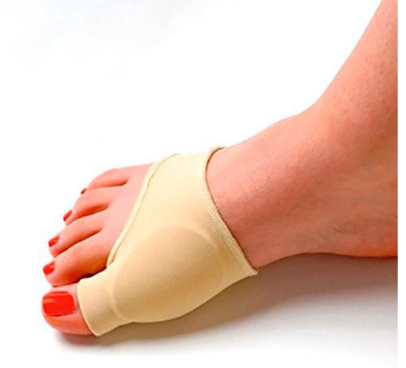
PROTECTOR DE JUANETES TIPO ALMOHADILLA